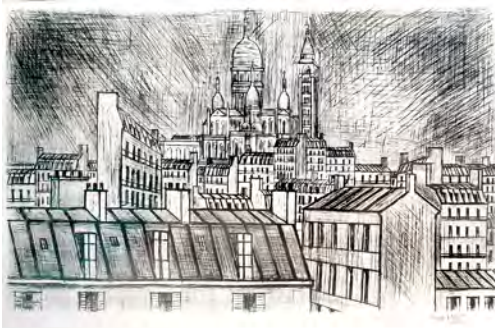
1 《モンマルトルのサクレ=クール寺院》 1995 ドライポイント

クレジット表記は各画像下の内容をご利用ください。(原題表記が必要ななどの場合お問い合わせください)