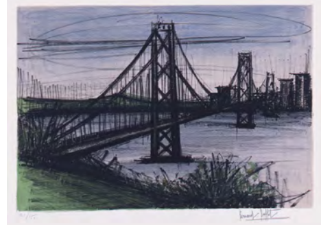
2 《アルバム サンフランシスコ》 1966 リトグラフ