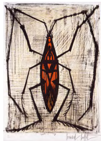
6 《たいこうち》1964 リトグラフ