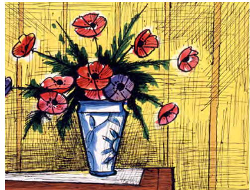
4 《アネモネのブーケ》1995 リトグラフ