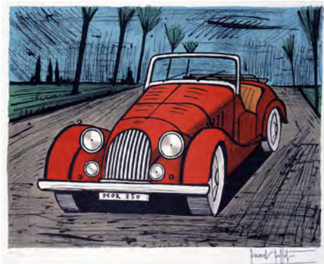
3 《モーガン》1985 リトグラフ