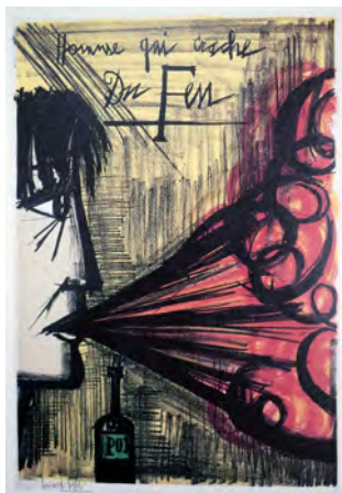
5 《火を吐く男》“私のサーカス”より 1968 リトグラフ