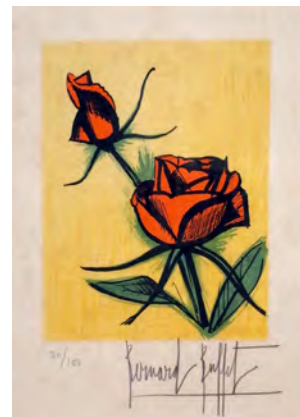
6 《小さなバラ》1979 リトグラフ