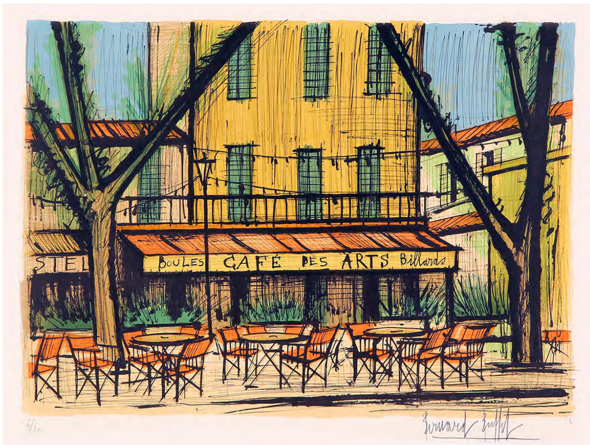
《カフェ・デ・ザール》1979 リトグラフ

ビュフェが愛した版画の技法“ドライポイント(銅版画)”と“リトグラフ”で表現した様々なモチーフ。油彩ともまた違った魅力を放つ、ビュフェの版画の世界をいっそうお楽しみください。