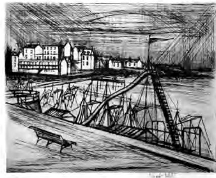
4 《サン=カストの海岸》1961 ドライポイント