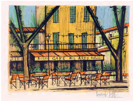
3 《カフェ・デ・ザール》1979 リトグラフ