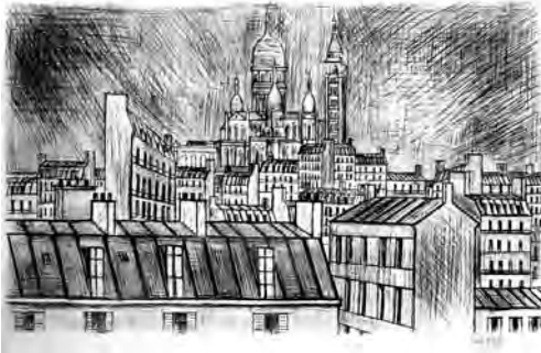
1 《モンマルトルのサクレ=クール寺院》 1995 ドライポイント

クレジット表記は各画像下の内容をご利用ください。(原題表記が必要などの場合お問い合わせください)