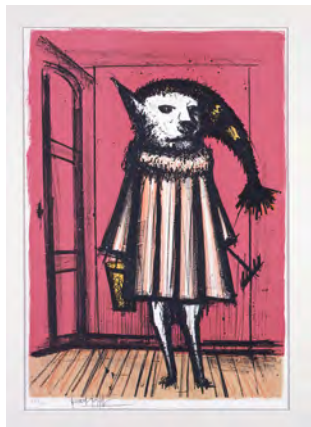
5 《学者犬》“私のサーカス”より 1968 リトグラフ