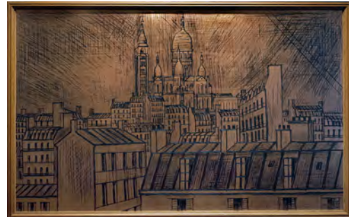
2 《モンマルトルのサクレ=クール寺院》 1995 銅原版